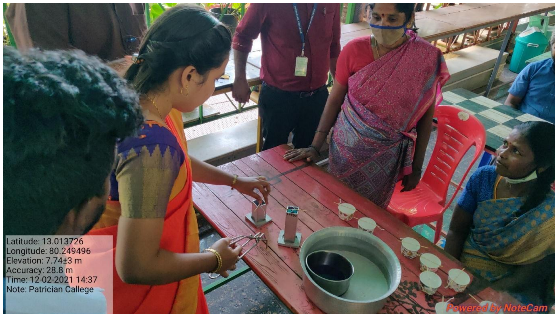
Training on candle making