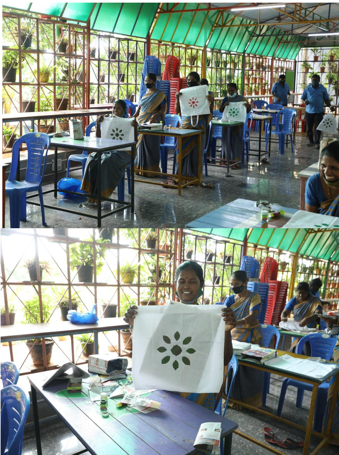
Completed Design on Cloth Bag