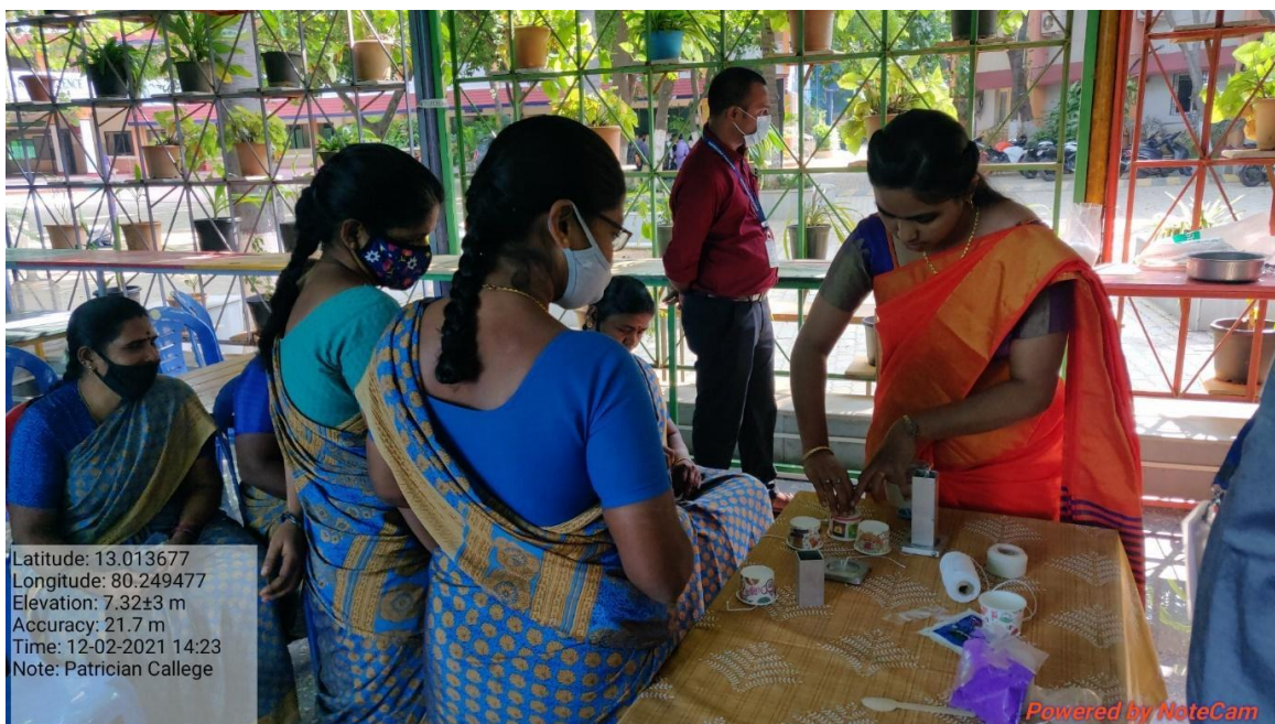
Training on candle making