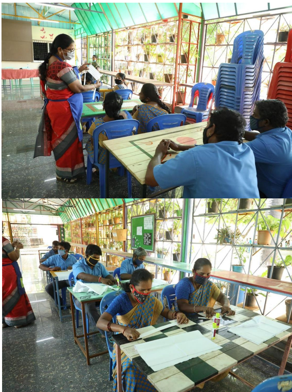
Supporting Staff making paper and cloth bag