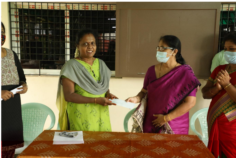
Principal is handing over the cash prize to the chief guest