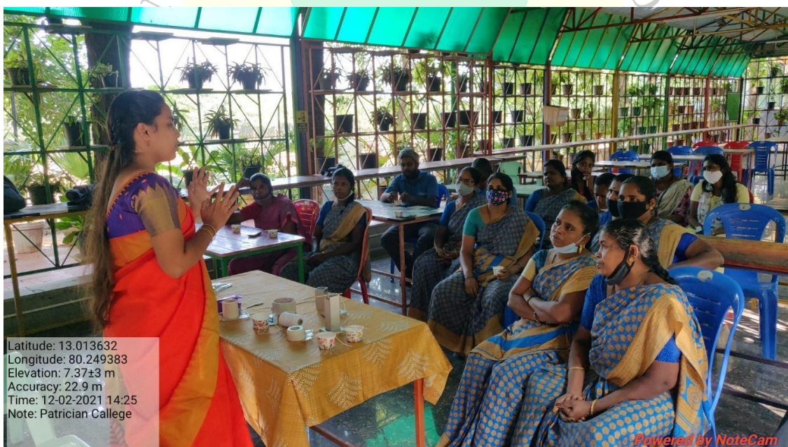
Training on candle making