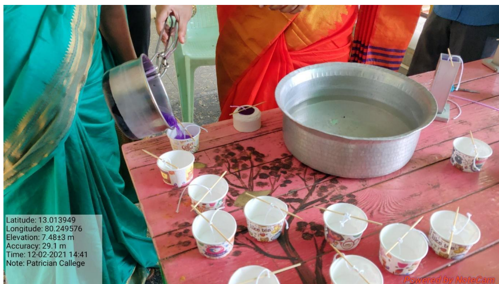
Training on candle making