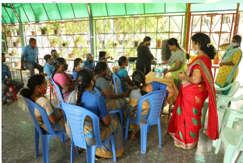
Narration on Juice making