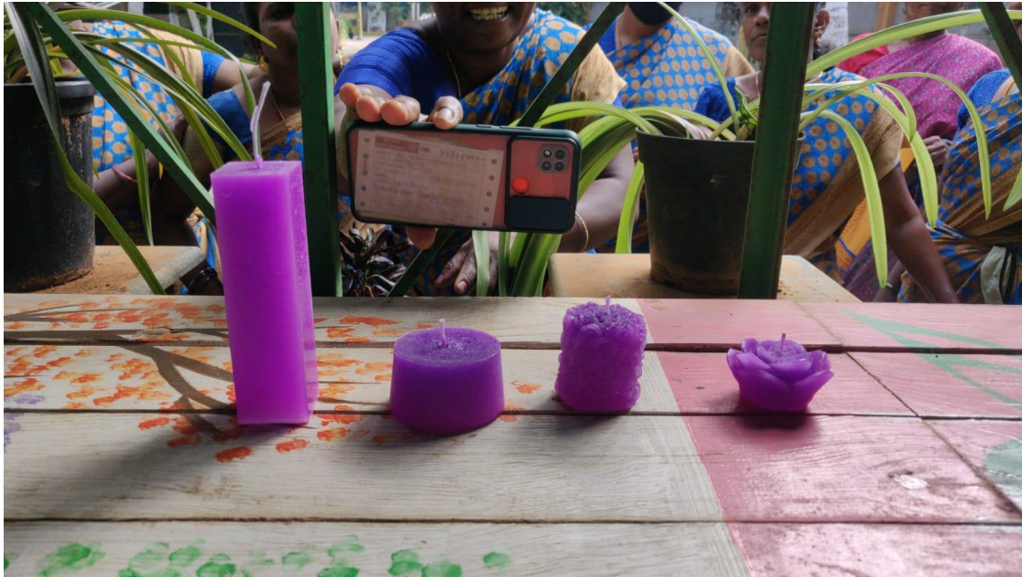
Candles prepared during the training