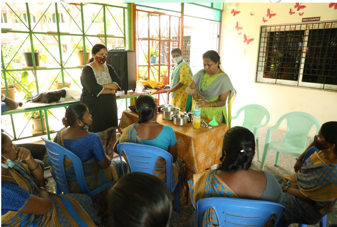
Narration on Juice making