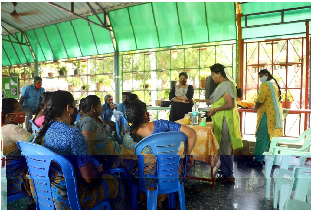
Narration on Juice making