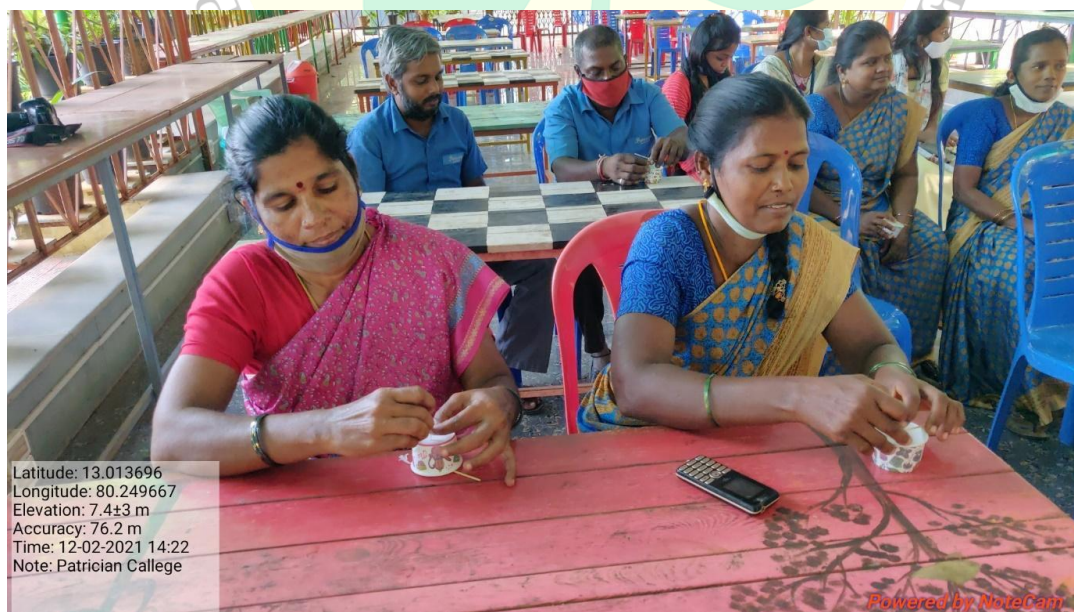
Training on candle making