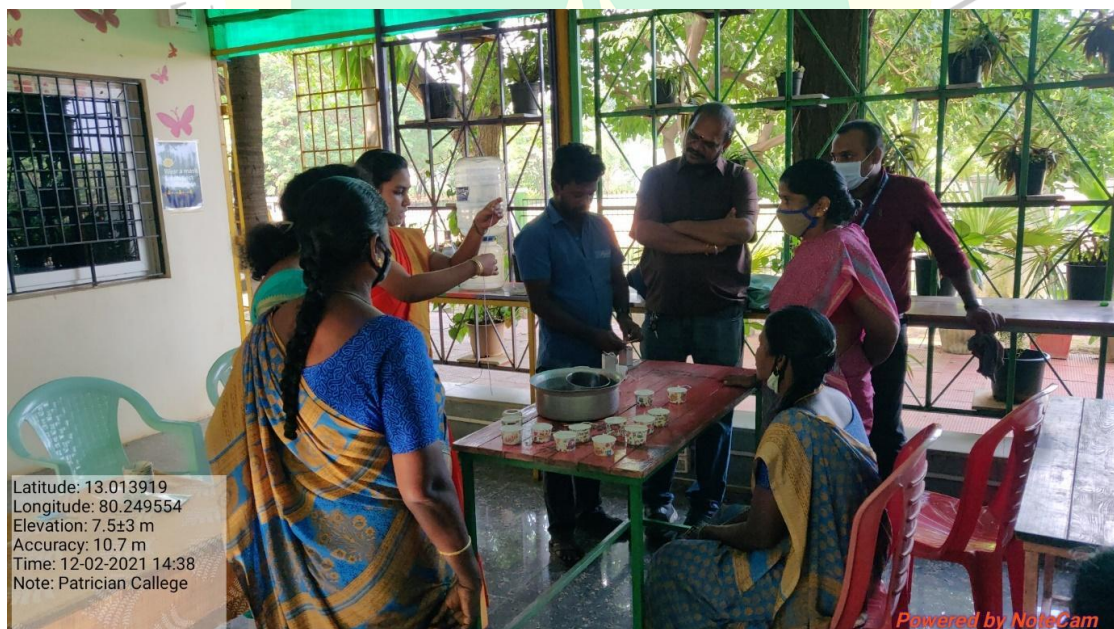
Training on candle making