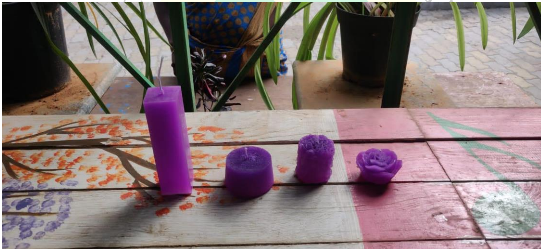
Candles prepared during the training