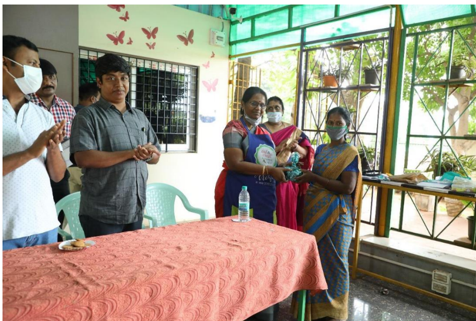
Reward for the Best Performer