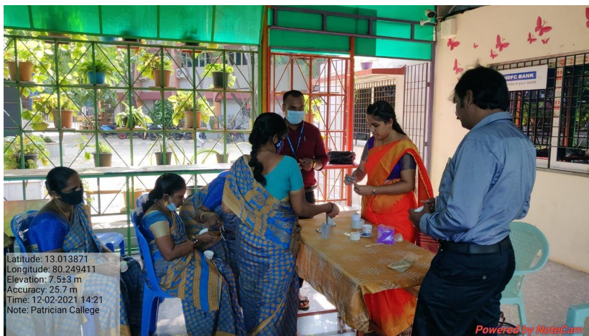
Explanation about candle making