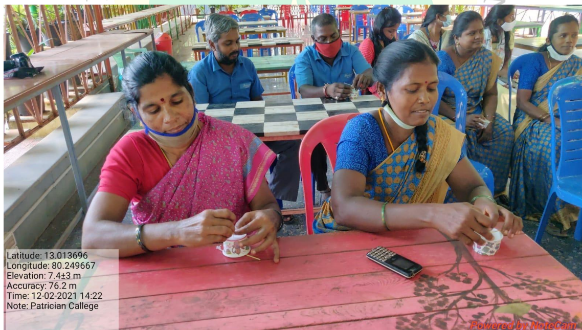
Training on candle making